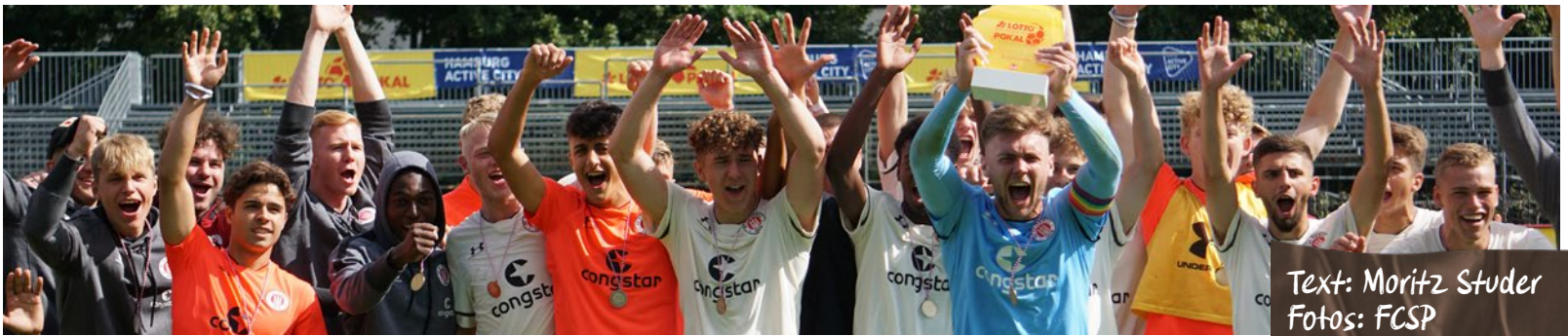
Text: Moritz Studer

Auch an diesem Wochenende waren unsere Young Rebels im Einsatz. Wie sich die U19 gegen den ETV, die U17 in Hannover oder auch alle anderen Nachwuchsmannschaften geschlagen haben, lest Ihr auf der Homepage oder unter fcstpauli.nlz auf Instagram.